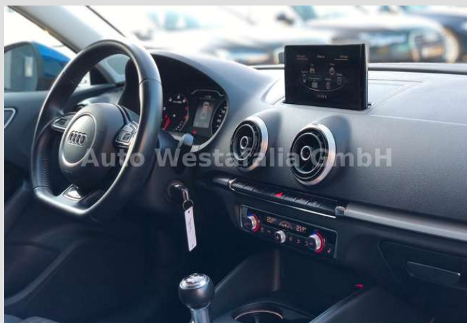
Eckendorfer Straße 30, 33609 Bielefeld