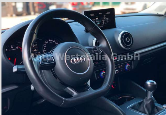
Eckendorfer Straße 30, 33609 Bielefeld