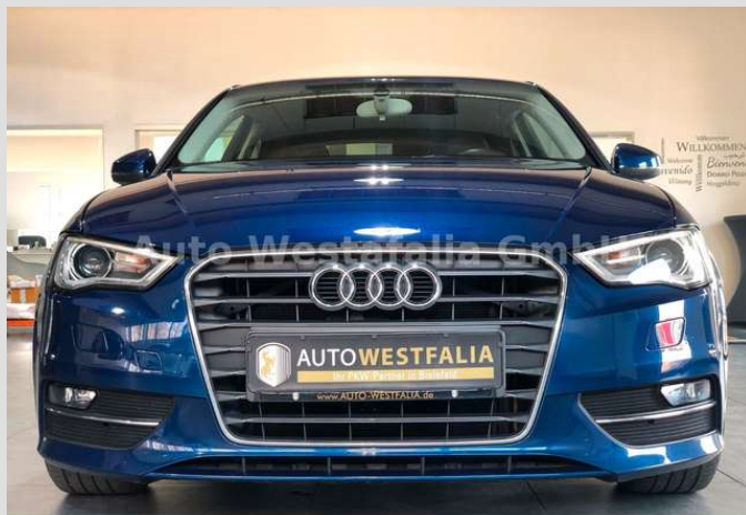
Eckendorfer Straße 30, 33609 Bielefeld