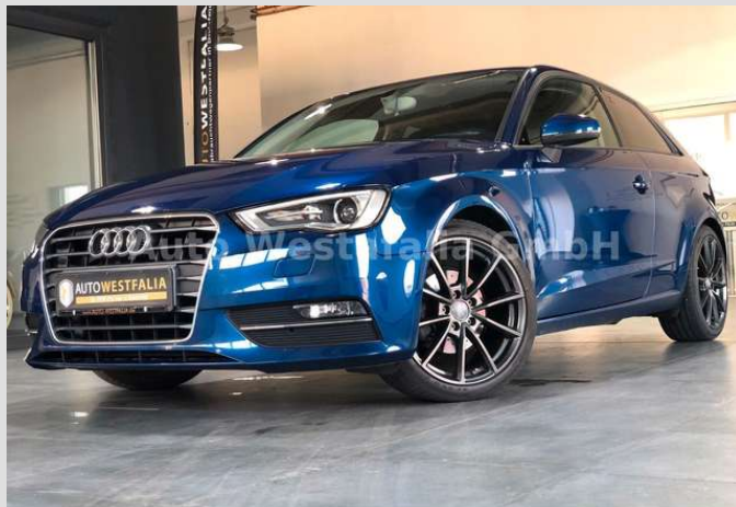
Eckendorfer Straße 30, 33609 Bielefeld