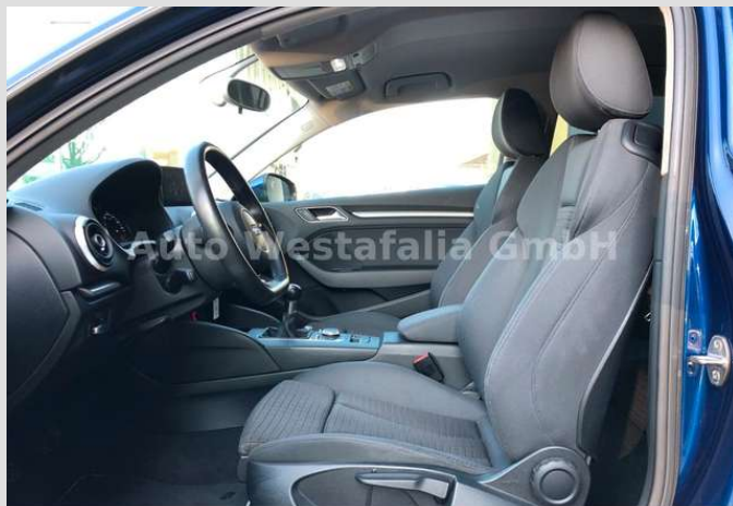
Eckendorfer Straße 30, 33609 Bielefeld