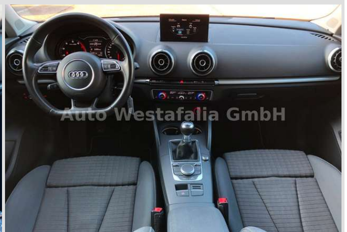
Eckendorfer Straße 30, 33609 Bielefeld