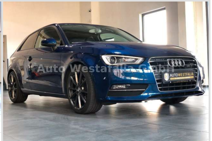
Eckendorfer Straße 30, 33609 Bielefeld