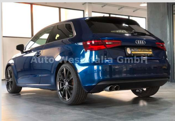
Eckendorfer Straße 30, 33609 Bielefeld