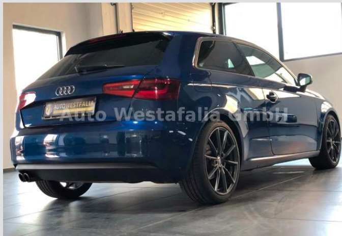
Eckendorfer Straße 30, 33609 Bielefeld