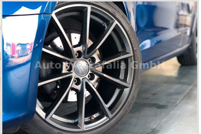
Eckendorfer Straße 30, 33609 Bielefeld