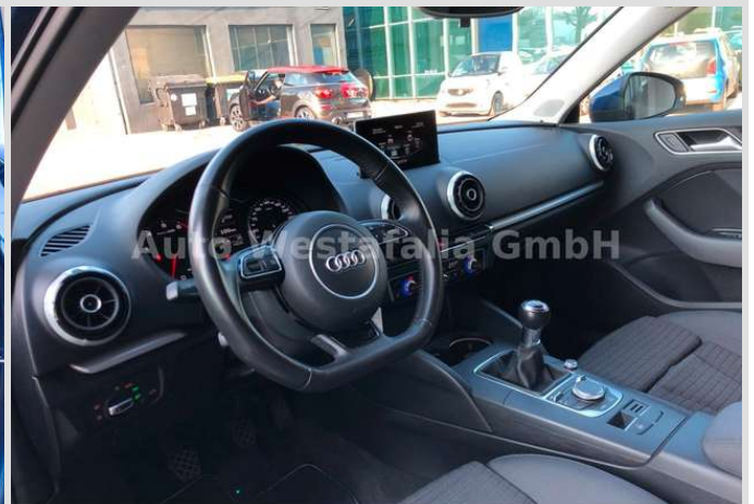
Eckendorfer Straße 30, 33609 Bielefeld