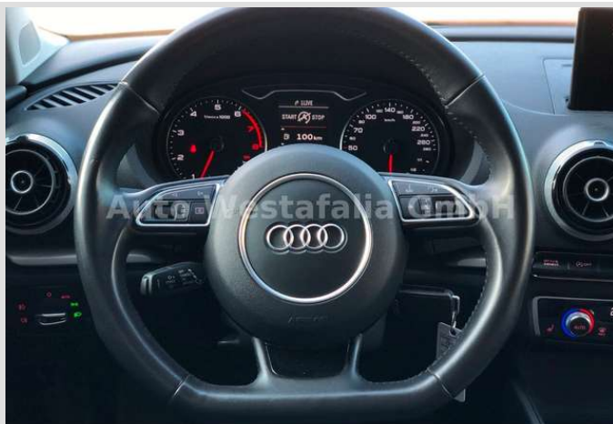
Eckendorfer Straße 30, 33609 Bielefeld