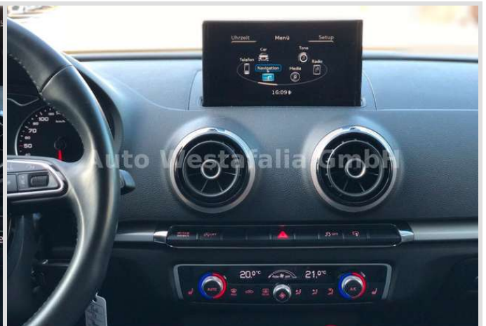
Eckendorfer Straße 30, 33609 Bielefeld