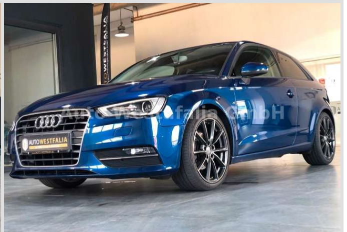
Eckendorfer Straße 30, 33609 Bielefeld