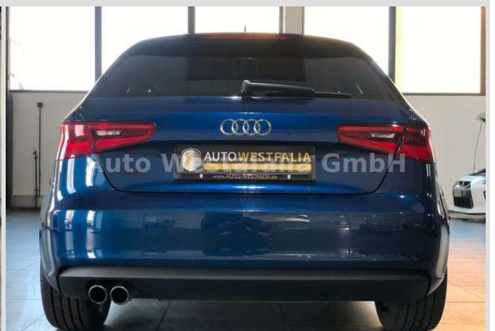
Eckendorfer Straße 30, 33609 Bielefeld