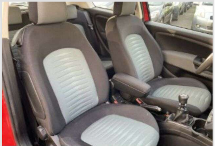
Carpoint GbR Brühl - 02232 149434