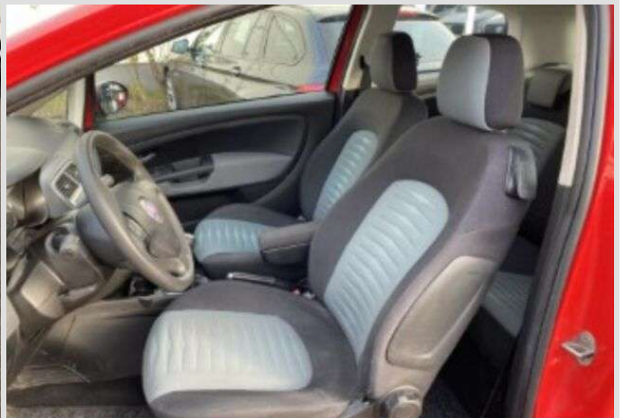
Carpoint GbR Brühl - 02232 149434