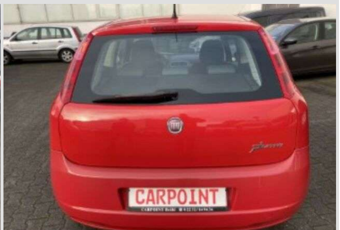
Carpoint GbR Brühl - 02232 149434