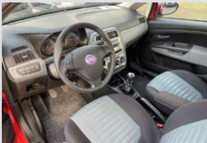
Carpoint GbR Brühl - 02232 149434