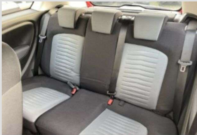
Carpoint GbR Brühl - 02232 149434