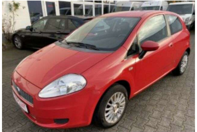
Carpoint GbR Brühl - 02232 149434