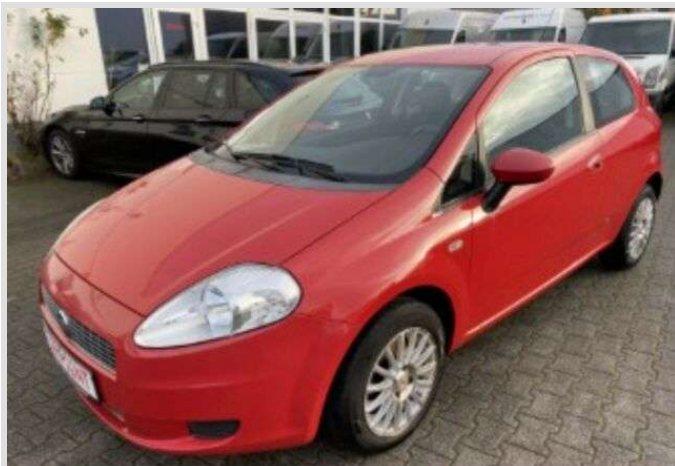
Carpoint GbR Brühl - 02232 149434