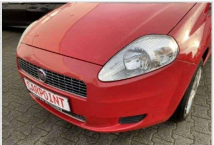
Carpoint GbR Brühl - 02232 149434