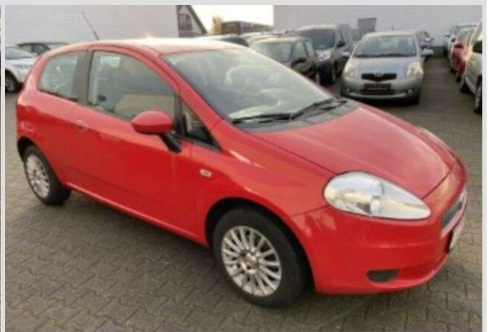
Carpoint GbR Brühl - 02232 149434