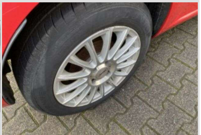
Carpoint GbR Brühl - 02232 149434