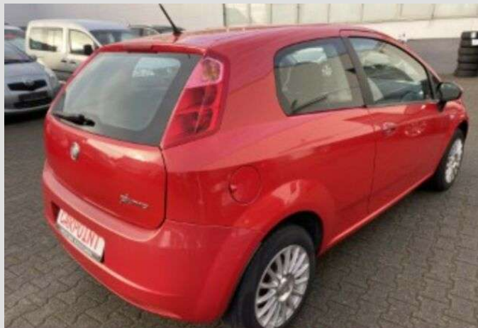
Carpoint GbR Brühl - 02232 149434