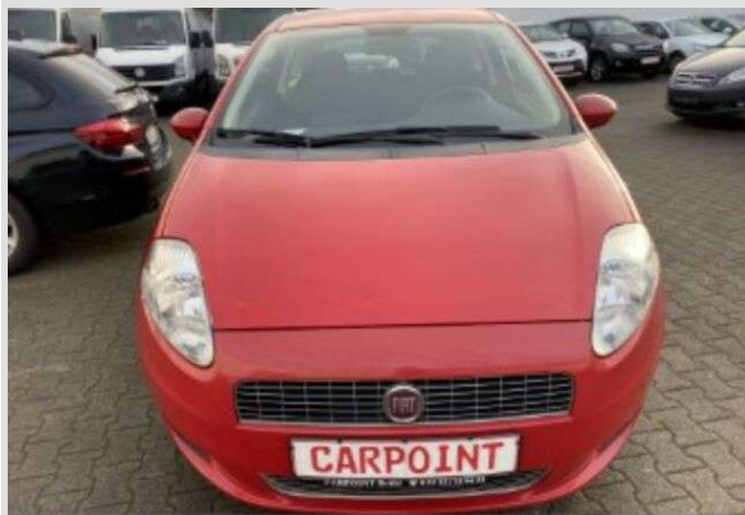
Carpoint GbR Brühl - 02232 149434