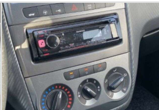
Carpoint GbR Brühl - 02232 149434