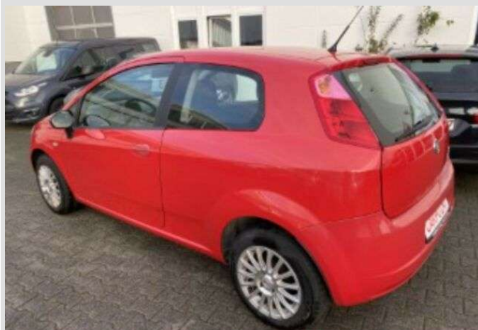
Carpoint GbR Brühl - 02232 149434